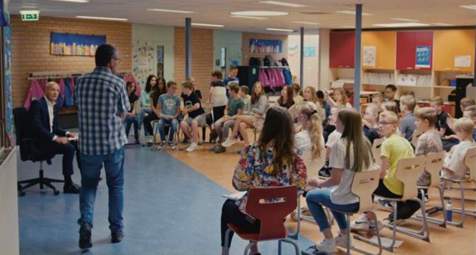
Frits van Eerd op bezoek bij groep 8 van basisschool 't Ven in Veghel.