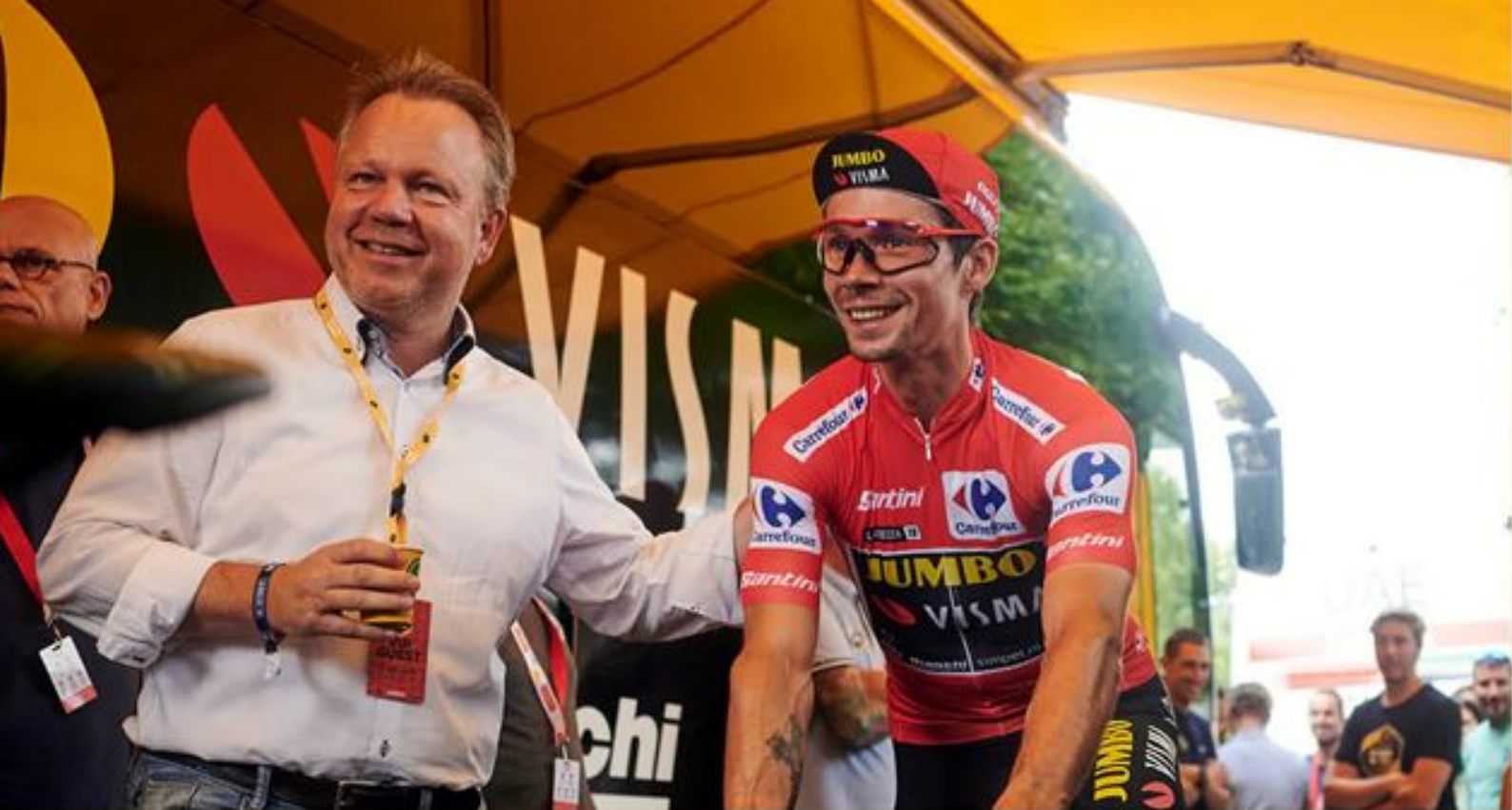
Ton van Veen samen met wielrenner Primož Roglič tijdens de Vuelta in Spanje.